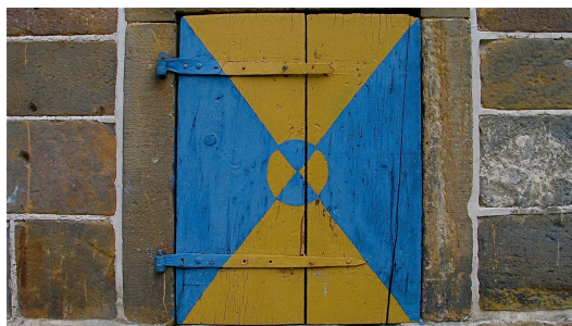
De stenen zijn afkomstig van de afgebroken kloosterkerk. Het varkensluik is nog steeds geschilderd in de Heeswijkse kasteelkleuren.