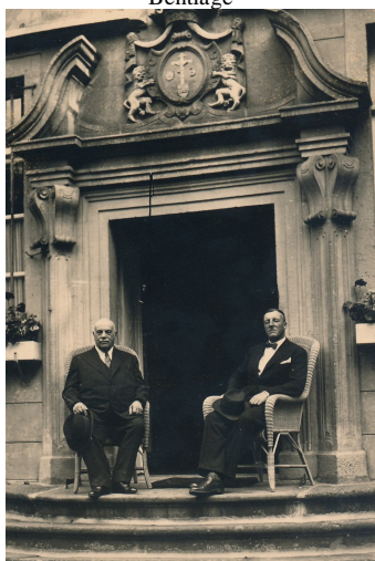
de laatste baron en zijn oom van wie hij Bentlage erfde

Met een topobiografische blik doemen buiten beelden op van pachthoeven tot vogelverblijven. Van kasteelkoetsen en een 'pausmobiel', van historische en eigentijdse architectuur. Na adoratieve bordesscènes mogen we binnen een blik werpen in de salons, kloostergangen, kapel en grafkelder. In de grote eetzaal staan de Heeswijkse baron met 'zijn' gilde en fanfare opgesteld als De Nachtwacht van Bentlage...!