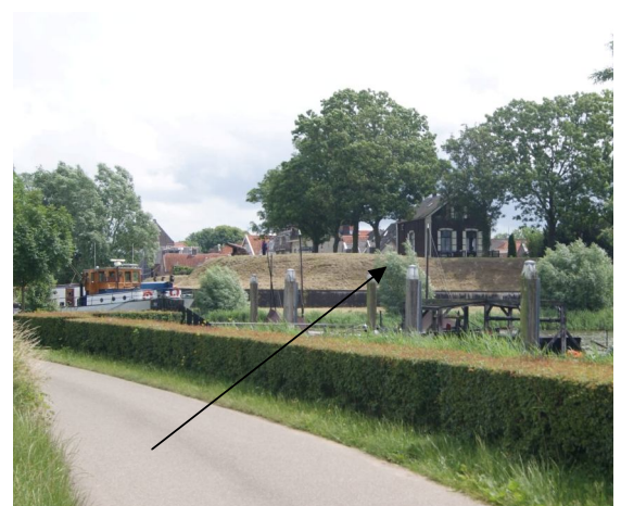
huis van dokter Tinus (uit de tv-serie)