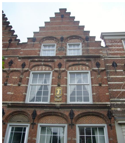
"dordse stijl" gevels